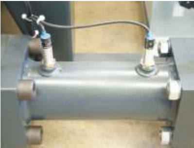
Verschleißfreie elektronische Sensoren Nonwearing electronic sensors