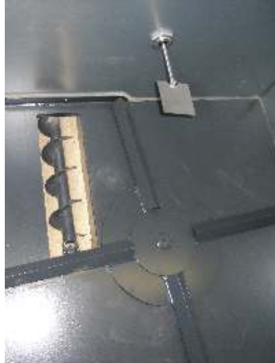
Rührwerk, Förderschneckenverdrichter und Füllstandsmelder im Inneren Agitator, conveyor worm supercharger and level sensor inside