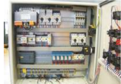
SPS-Steuerung / PLC-Control