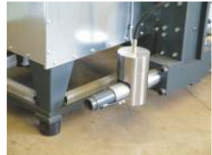
Transportrohr-Anschluss Transport pipe connection