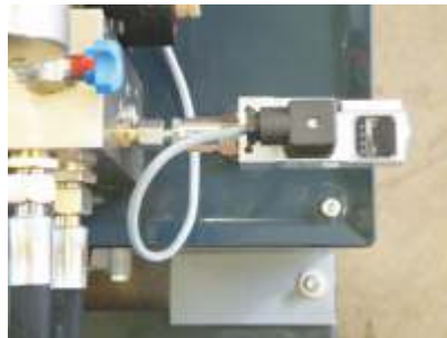
Einstellbarer Preßdruck Adjustable pressure