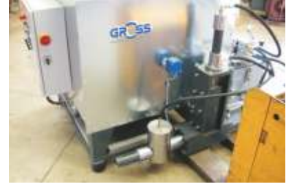
Einfacher Transport / Easy transport