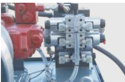
Solide Ventil und Pumpentechnik