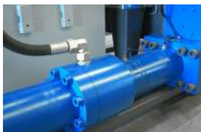
Starke Verpressung durch großzügig dimensionierte Zylinder