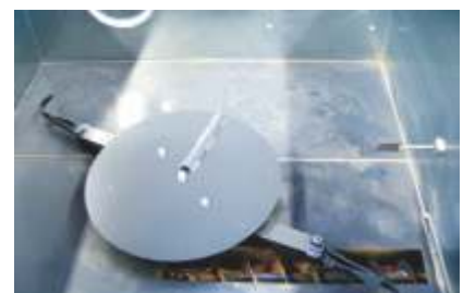
Robustes Rührwerk, Austragarme mit Federmechanismus, Schneckenvorverdichtung