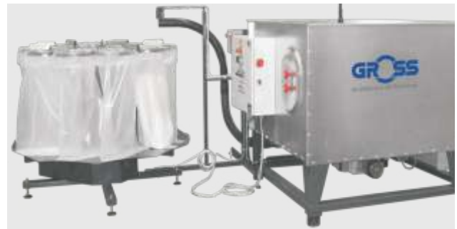
Pressen mit Transportrohr und Absackanlage