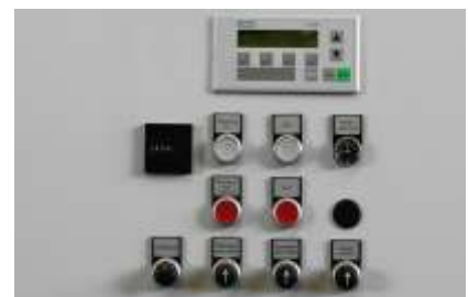
Übersichtliche Bedienung mit Handfunktionen. Optional mit Klartextdisplay