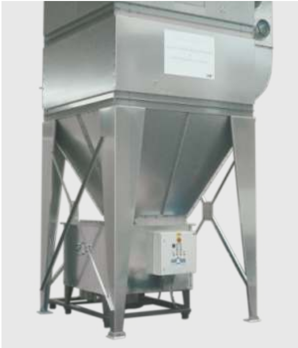
GP-Pressen unter Filteranlage

Darüber hinaus sind sie einfach in der Wartung und überzeugen durch niedrige Betriebskosten. Die GP-Serie ist deshalb die erste Wahl für die Holzverarbeitende Industrie.