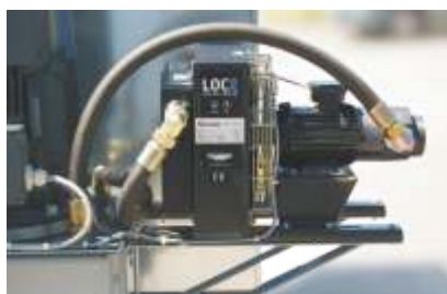
Optional: Ölkühlung für Hydraulikaggregat