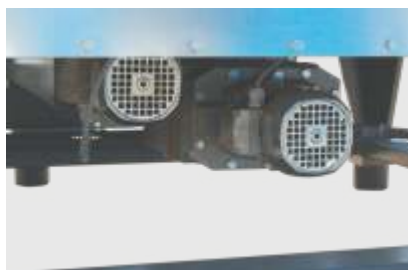
Starke Getriebemotoren für Schnecken- vorverdichtung und Rührwerk