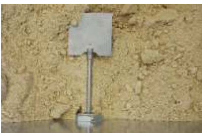
Optional: Füllstandsmelder für automatischen Start der Maschine