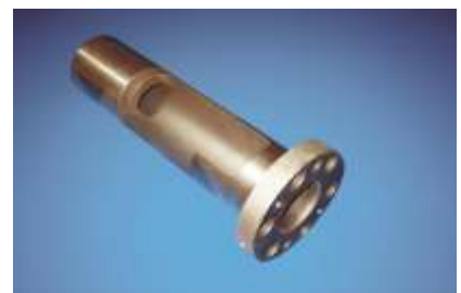
Auswechselbare durchgängig gehärtete Preßraum-Verschleißbuchse