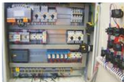
Schaltschrank / SPS-Steuerung