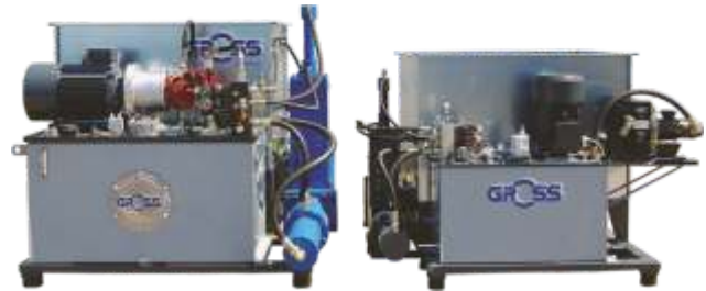
Rechts- und Linksausführung der Presseneinheit