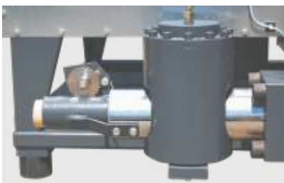
Stranglängenüberwachung zur automatischen Brikettierlängenregulierung